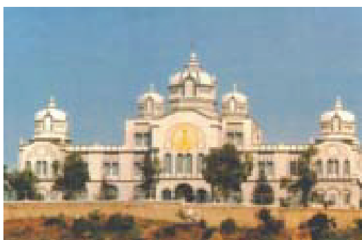
Gli edifici amministrativi dell'Università Sri Sathya Sai

I college Sathya Sai affiliati all'università, come pure altri college Sathya Sai dell'India, sono modelli di eccellenza per l'istruzione universitaria.