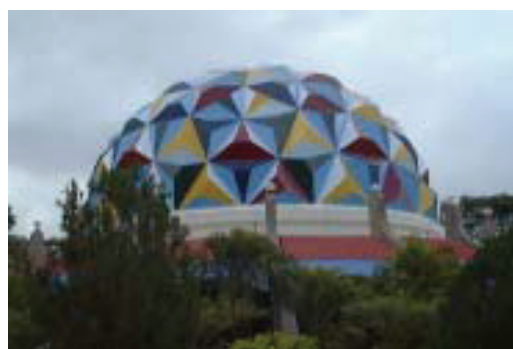
Il planetario dell'Università Sri Sathya Sai